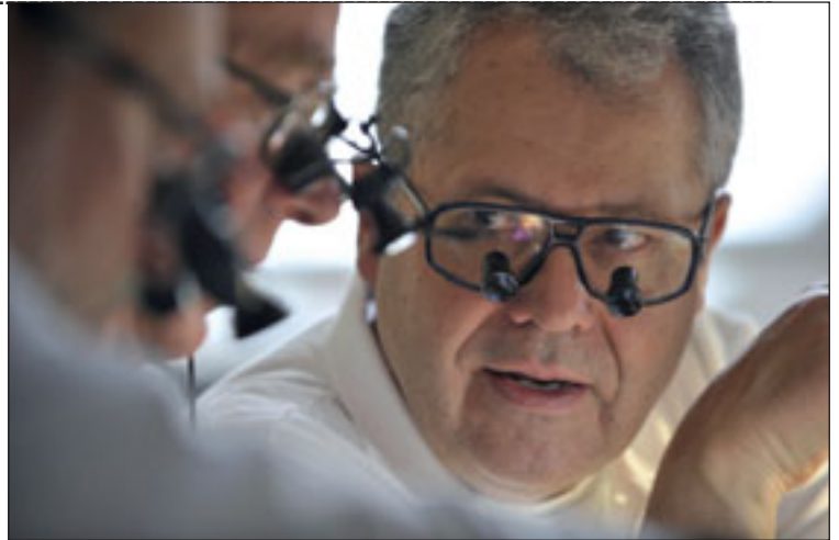
Praktiker